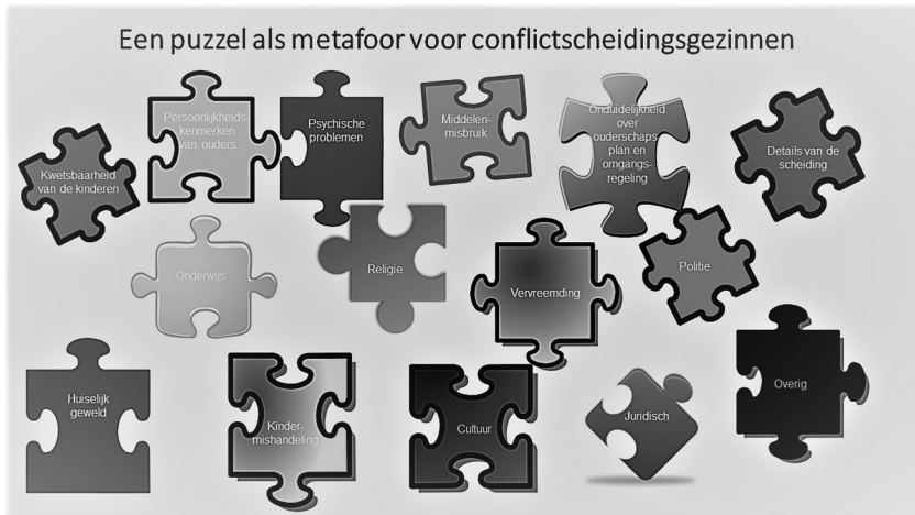
Figuur 1 Noot. Naar Hurwitz, H. (2016)

aanhoudende conflicten tussen de ouders, en vaak ook onderdeel van de oplossingsstrategie kunnen zijn. Hurwitz (2016) noemt dit de vraag naar: “what is driving the conflict”? Gezien de complexiteit van deze gezinnen, is het meestal niet slechts één factor uit de puzzel die daarbij een rol speelt.